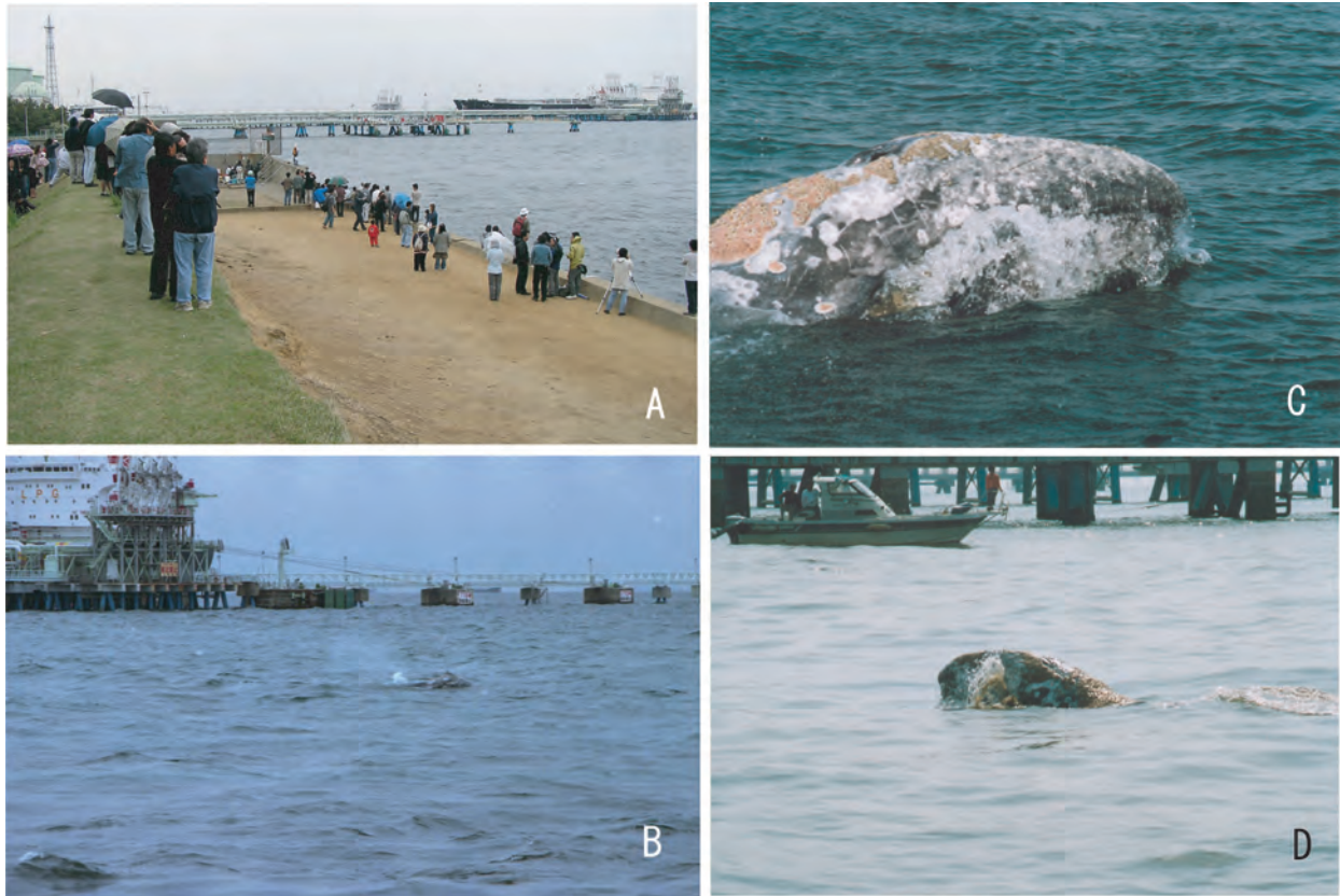
図3 A コククジラの潜水、浮上行動が観察された袖ヶ浦市沿岸域。B 浮上したコククジラ。C 浮上したコククジラのヒゲ板の隙間から水がはき出されている。D ヒゲ板に海藻のようなものが附着している。A、Bは2005年5月6日撮影。C、Dは5月5日撮影。