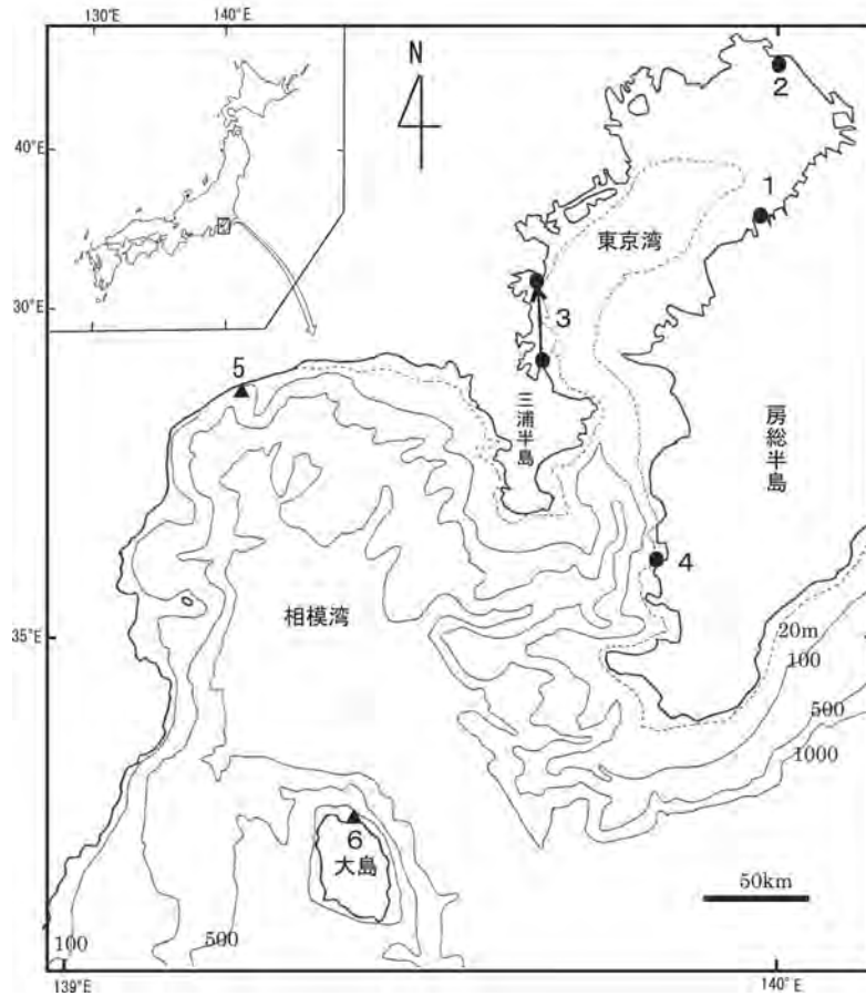
図1 東京湾とその周辺におけるコククジラが観察された地点。●今回報告した地点。1 袖ヶ浦市長浦、2 習志野市茜浜、3 横須賀市長浦町沖～横浜市千鳥町沖、4 南房総市小浦。▲過去に記録があった地点。5 小田原市国府津海岸、6 東京都大島町岡田。