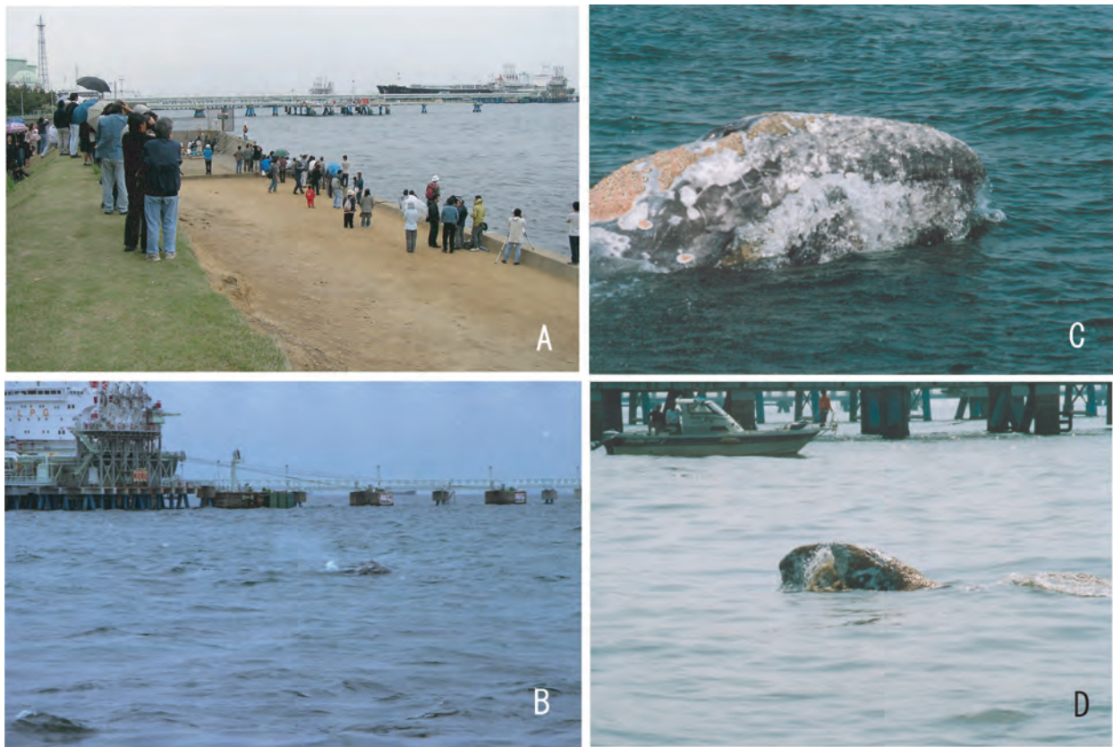
図3 A コククジラの潜水、浮上行動が観察された袖ヶ浦市沿岸域。B 浮上したコククジラ。C 浮上したコククジラのヒゲ板の隙間から水がはき出されている。D ヒゲ板に海藻のようなものが附着している。A、Bは2005年5月6日撮影。C、Dは5月5日撮影。